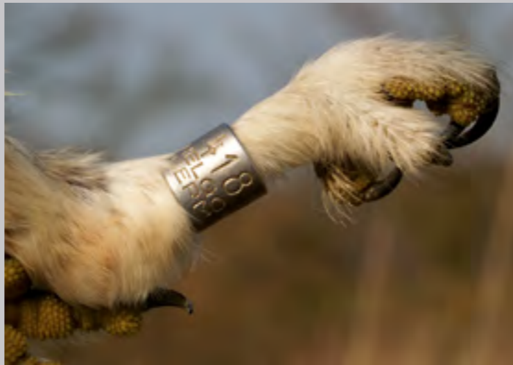
Beringter Steinkauz | W. Rusch