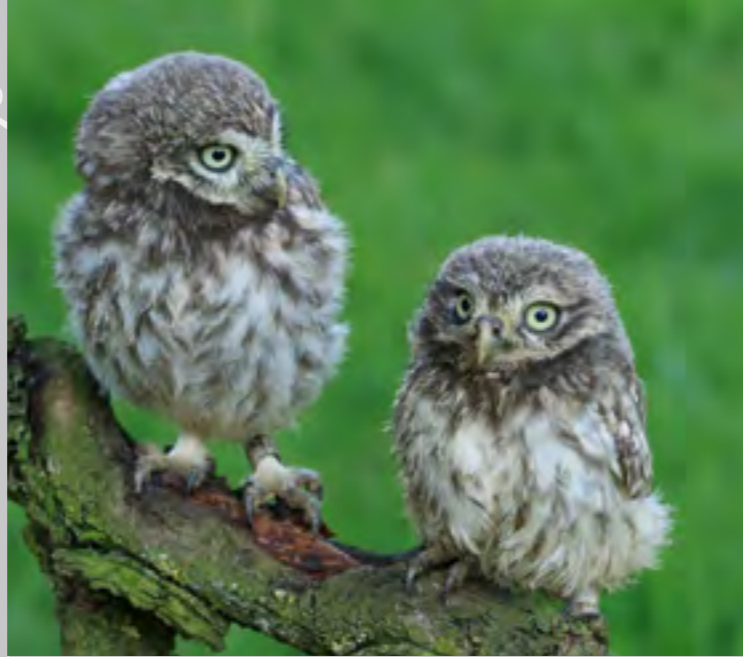
Junge Steinkäuze | W. Rusch