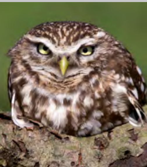
Steinkauz | W. Rusch

Der Steinkauz stammt ursprünglich aus dem Mittelmeerraum und den Steppen Asiens. Von dort aus hat er die bäuerlichen Kulturlandschaften Mitteleuropas besiedelt. Seit Jahrhunderten brütet und jagt diese possierliche Eule nun bei uns in unmittelbarer Nachbarschaft zum Menschen.