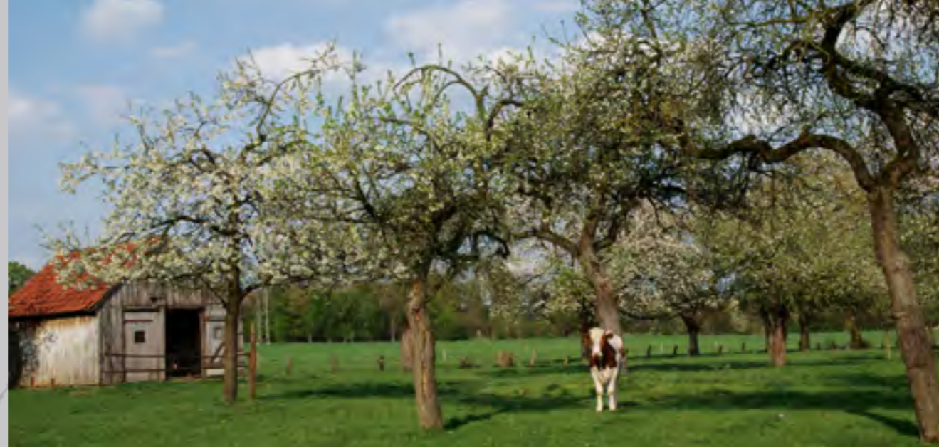
Hofnahe Obstwiesen vereinen in idealer Weise Brutplatz und Jagdlebensraum des Steinkauzes.

Dass der Steinkauz bei uns aktuell noch recht häufig vorkommt, ist dem Engagement von Naturschützern und Obstwiesenbesitzern zu verdanken. Diese haben insbesondere durch das Anbringen hunderter künstlicher Brutröhren und der Nutzung der Obstwiesen gemeinsam zu einer Bestandsstützung beigetragen. Das Naturschutzzentrum Kreis Coesfeld e.V. hat in den letzten Jahren mehr als 5.000 Obstbäume für die Anlage neuer und die Ergänzung vorhandener Obstwiesen kostenlos zur Verfügung gestellt.