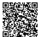
LWL-Museum für Naturkunde