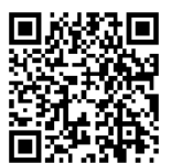
Film: Lebensraum Hecke

Der Beitrag des SWR stellt für Planet Schule den Lebensraum Hecke am Beispiel der Rebhühner dar. Im Münsterland gibt es nur noch sehr wenige Rebhühner (vgl. auch Online-Material zum Rebhuhn).