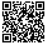
Die Sendung mit der Maus

Die Sendung mit der Maus hat einen informativen Film über Fledermäuse gedreht. Wir empfehlen, den Film gemeinsam mit der Klasse anzuschauen, um dann mit dem Steckbrief weiterzuarbeiten (in Teilen oder ganz).